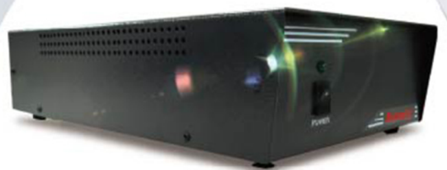
JD2020 LED Thermal Resistance Tester