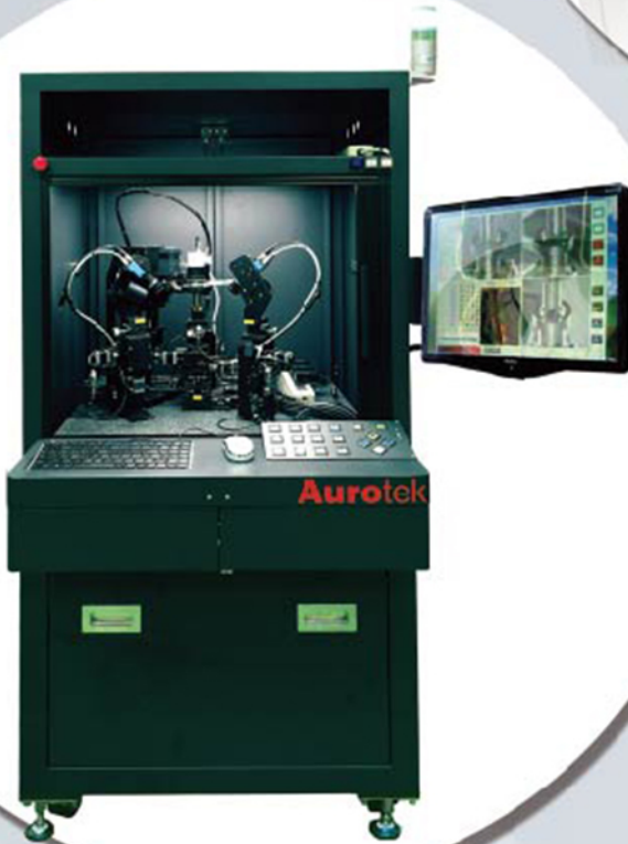
ARSL-5200 Automatic Alignment & Laser Welding