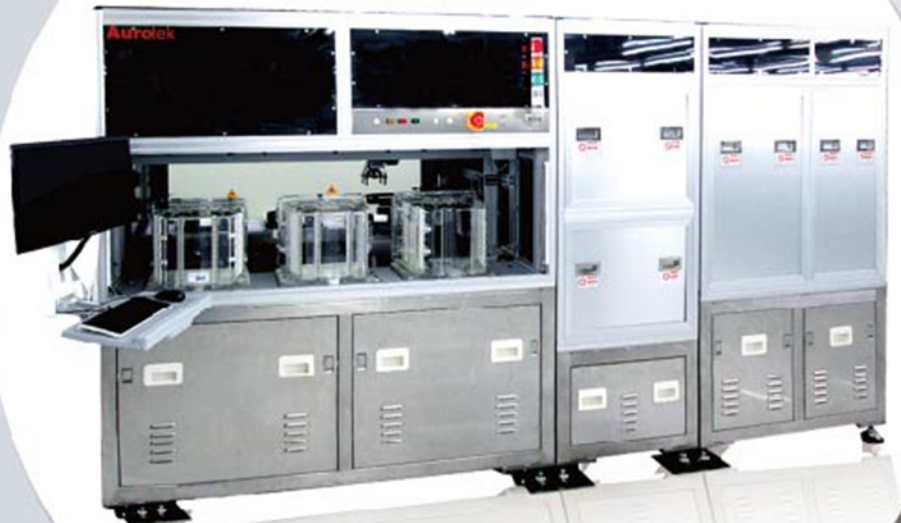
PKGS-A1001 Wafer Sorter AOI